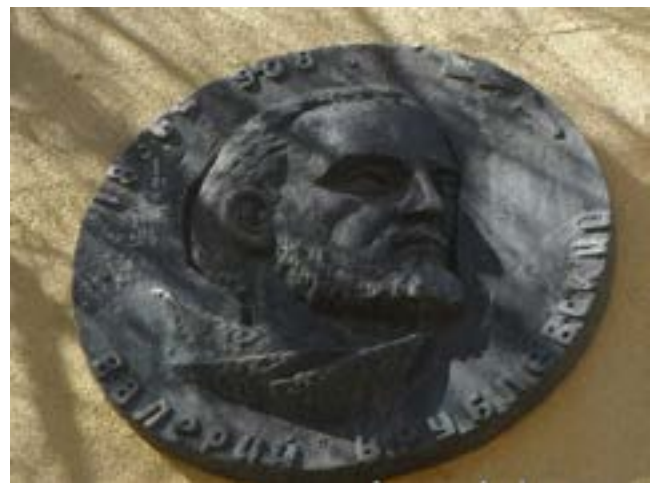
Мемарыяльная шыльда на вуліцы Урублеўскага

са спасылкай на папярэднія дадзеныя, што на пляцоўцы гары знойдзены парэшткі папличніка К.Каліноўскага - Зыгмунта Серакоўскага. Папярэднія дадзеныя сведчаць пра тое, што ўсе выяўленыя парэшткі належаць удзельнікам паўстання, усе сям'яра былі пакараныя смерцю, у іх звязаныя за спіной рукі, целы былі засыпаныя вапнай. Мяркуюцца, што сярод фрагментаў целаў ёсць і парэшткі Кастуся Каліноўскага. Памяць пра героя паўстання ў нашым горадзе захоўваецца ў назве вуліцы, а адзіны помнік на Беларусі, нават не помнік - бюст К. Каліноўскаму, знаходзіцца ў Свіслачы.